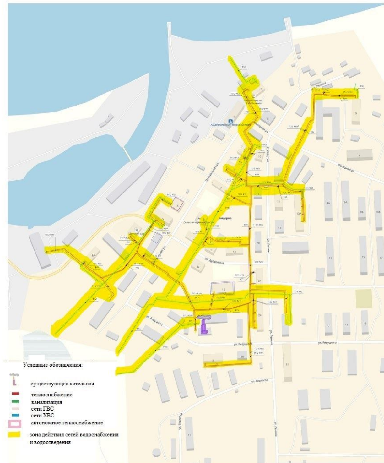
Схема инженерных сетей п. Амдерма Сельского поселения "Посёлок Амдерма" Заполярного района Ненецкого автономного округа