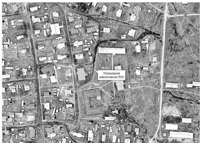
Схема размещения места (площадки) накопления твердых коммунальных отходов ТКО на территории СП «Канинский сельсовет» ЗР НАО (с. Несь, ГБУК НАО «Несский Дом народного творчества»)