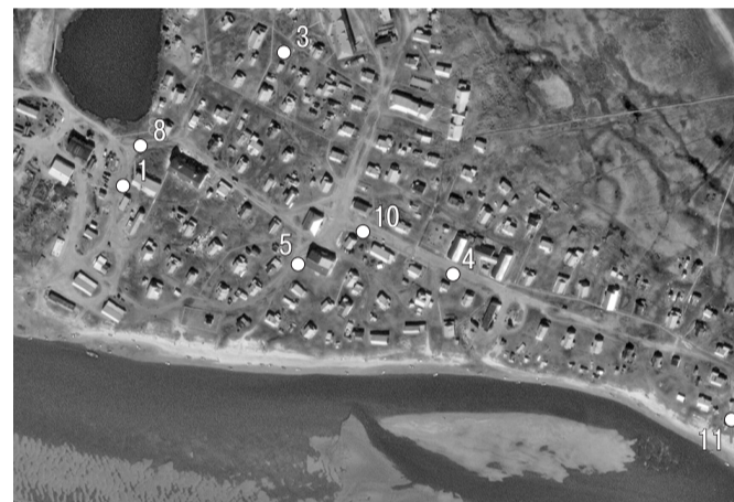
Схема размещения места (площадки) накопления твердых коммунальных отходов ТКО на территории СП «Андегский сельсовет» ЗР НАО (д. Андег)