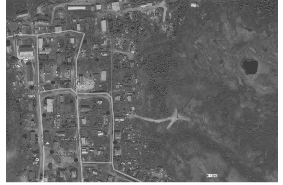
Схема размещения места (площадки) накопления твердых коммунальных отходов ТКО на территории СП «Пешский сельсовет» ЗР НАО (с. Нижняя Пеша, СП «Пешский сельсовет» ЗР НАО)

Приложение 2 к постановлению Администрации Заполярного района от 25.01.2022 № 11п