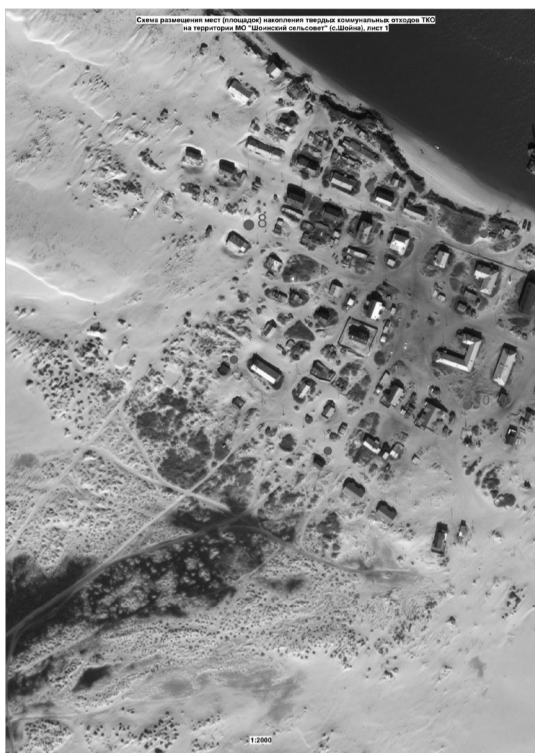
Схема размещения места (площадки) накопления твердых коммунальных отходов ТКО на территории СП «Шоинский сельсовет» ЗР НАО (с. Шойна, СП «Шоинский сельсовет» ЗР НАО)